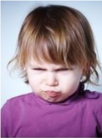
Auteur inconnu est soumis à la licence CC BY-SA-NC